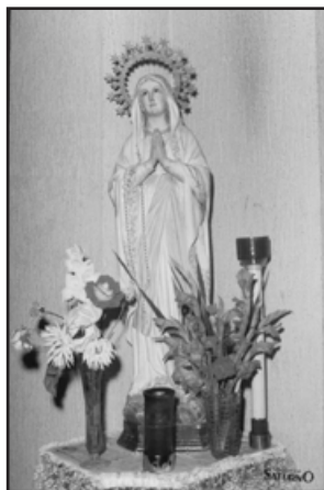
Nuestra Virgen de Lourdes en el año 1984, antes de su restauración.

Pero si, además, queréis colaborar con la nueva sección, podéis enviar un correo electrónico a secretario@lassietepalabras.com y formar parte de la sección. Se os convocará para preparar y ayudar en las celebraciones, lecturas, etcétera.