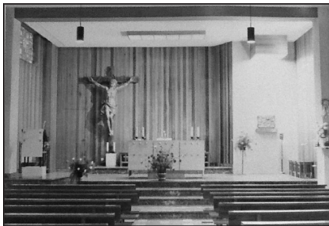
Entre los 70 y comienzos de los años 80: Nuestra Señora y nuestro Cristo, sin nuestro patrón, san José de Calasanz.

Lo más importante, ahora y siempre, para ayudar a nuestra Archicofradía de Lourdes, es acudir todos los años al triduo que, en honor de Nuestra Señora, celebramos en la iglesia de nuestro colegio, los días 9, 10 y 11 de febrero, con el siguiente horario: A las 19:30 horas: rezo del Santo Rosario. Y a las 20:00 horas: triduo y Santa Misa. Solo con la asistencia a los citados actos, le prestamos un servicio enorme a la Virgen del Colegio.