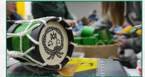
Taller de manualidades cofrades.