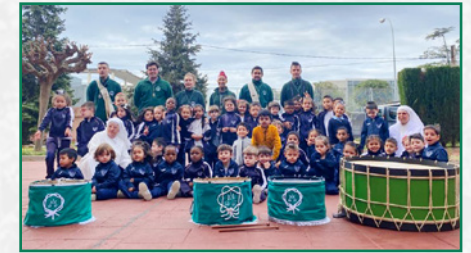
Presentación en la guardería La Inmaculada.

A lo largo de la cuaresma y durante cada viernes, también se desarrolló el taller de manualidades cofrades. Este tocaba a su fin tras varias jornadas en el que prepararon tamborcitos y recortables cofrades por parte de jóvenes y mayores. Concluyó la cuaresma con la procesión de la Virgen de los Dolores, organizada por la Cofradía de Jesús Nazareno y la parroquia de Santiago Apóstol.