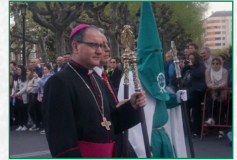
Procesión del Jueves Santo.

El Viernes Santo se inició con las velas en la Iglesia, junto al Monumento y a nuestra Imagen Titular. Por la tarde, la Muerte del Señor, segundo momento del Triduo Pascual, precedió a la salida de la procesión, en traslado hasta la plaza del Mercado para unirnos a la Procesión del Santo Entierro junto al resto de cofradías de la ciudad. Merece destacarse una petalada que nos fue ofrecida en la esquina de las calles Portales y Rodríguez Paterna, junto al Ateneo Riojano, que se conjugó con una espectacular actuación de nuestros portadores.