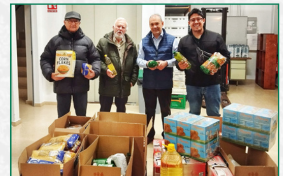
Entrega en Cocina Económica de Logroño.