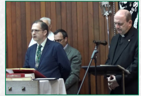
Toma de posesión del nuevo Hermano Mayor.