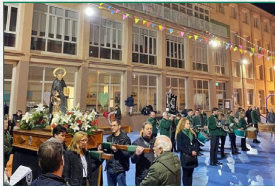
Procesión en el patio del colegio.