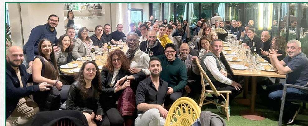
Cena de Navidad de la Sección de Instrumentos.