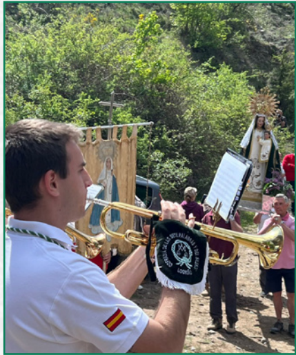
Tocando a la llegada de la Virgen