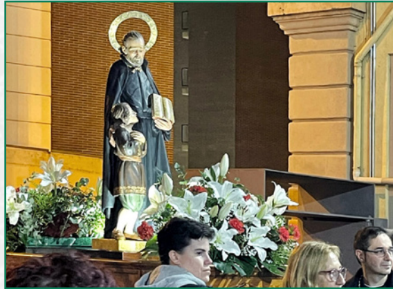
El Santo a su entrada al patio.