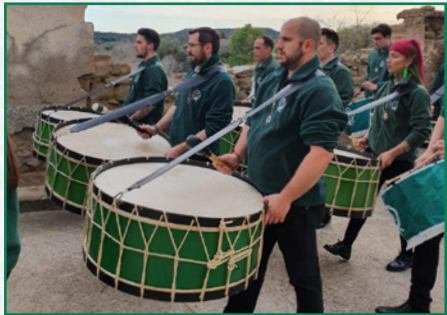
Exaltación en Abiego.