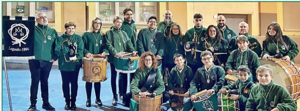
Banda de trompetas y tambores.