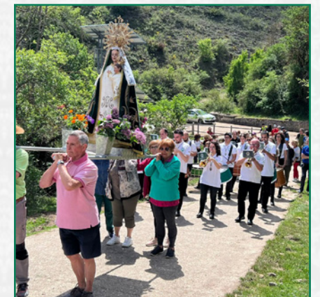
Acompañando al paso de la Virgen