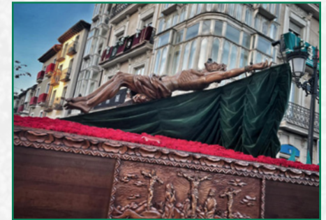
Procesión del Jueves Santo.

Numeroso público en las calles y mucha gente también en el patio del colegio para la despedida y retirada del Cristo. Con el reparto de claveles concluyó la jornada y las procesiones de 2023. Sin embargo todavía quedaban los últimos actos de la Semana Santa: la recogida del sábado por la mañana y el último momento del Triduo Pascual, la Vigilia Pascual en la Iglesia del colegio, centro litúrgico de todo el año en el que celebramos la Resurrección del Señor, centro y fundamento de nuestra fe.