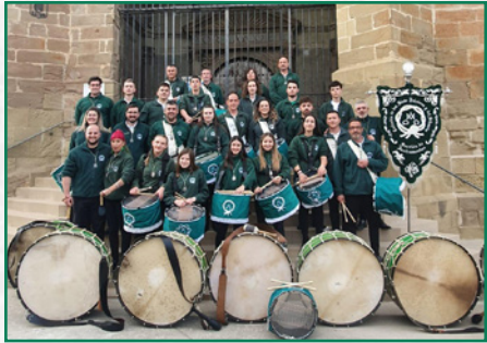
Nuestros hermanos en Abiego.