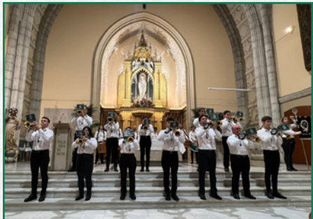
Concierto de marchas procesionales.

La sección de instrumentos viajó en 2023 a las localidades de Arnedo y Abiego (el grupo de exaltación). En el municipio riojabajeño participó en la XVIII Exaltación de Bandas de Cofradías y en la localidad oscense, en el VI Encuentro de Bombos y Tambores Villa de Abiego, celebrado tras tres años de interrupción por la pandemia.