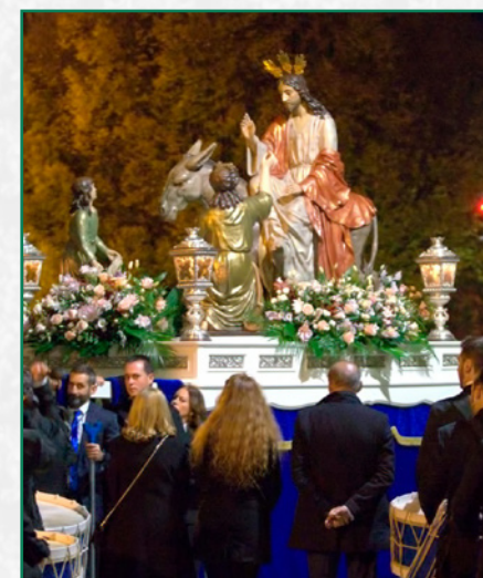
Procesión Extraordinaria, La Borriquilla.

El pasado 18 de junio, se celebró en nuestra sede canónica la Santa Misa conmemorativa del 50 aniversario de la reforma y bendición de la actual iglesia.