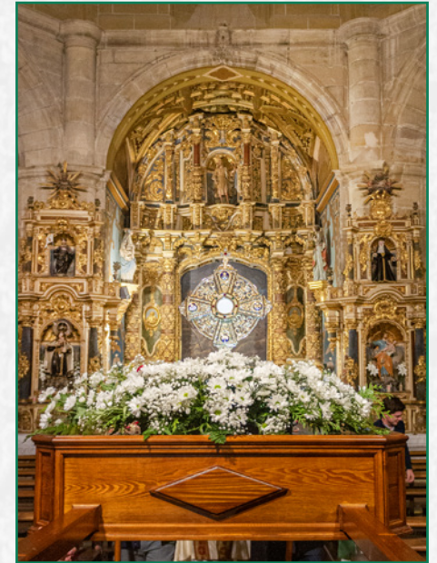
Nuestras andas con el Santísimo Sacramento.

La Adoración Nocturna invitó también al Hermano Mayor y a la cofradía a asistir a la vigilia. Así que, en la tarde del primer sábado de septiembre, una representación de la cofradía se personó en Briones para asistir al acto. El pronóstico del tiempo no era halagüeño: una gota fría afectaba a España ese fin de semana, con lluvias generalizadas. De hecho esa misma mañana se recogieron hasta veinte litros de lluvia por metro cuadrado en Logroño. Pero la tarde, aunque fresca, salió seca y la Vigilia pudo celebrarse completamente, incluida la procesión.