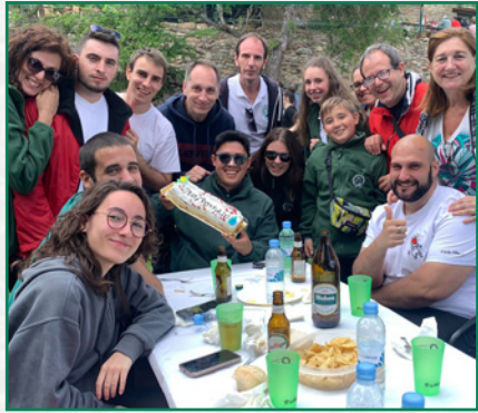
Comida en hermandad.