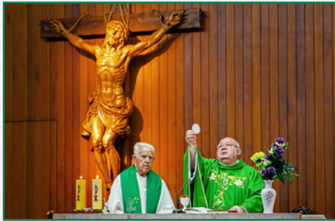
Santa Misa Conmemorativa.