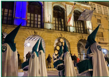
Procesión en Haro, Miércoles Santo.