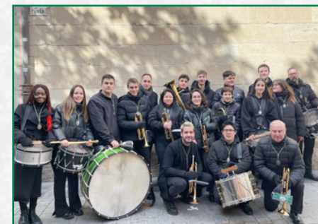
Encuentro Diocesano en Logroño.