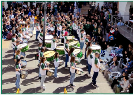
LPER, en Hjar.