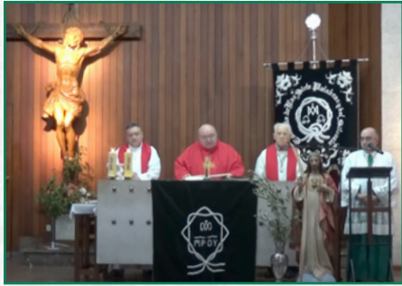
Santa Misa, Domingo de Ramos.