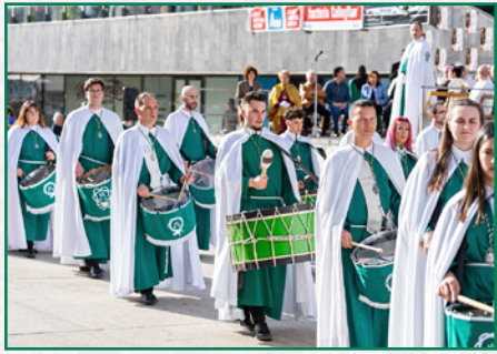
Exaltación en Arnedo.