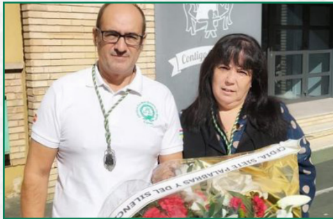
Ofrenda floral Virgen de Valvanera.

En la mañana del domingo 4 de junio acompañamos en Jubera a la procesión del Cristo Abarrancador. Tras la ofrenda floral por parte de la cofradía, la banda de tambores y bombos participó con sus marchas en la procesión, bendición de campos y Santa Misa en la iglesia de San Nicolás de Bari.