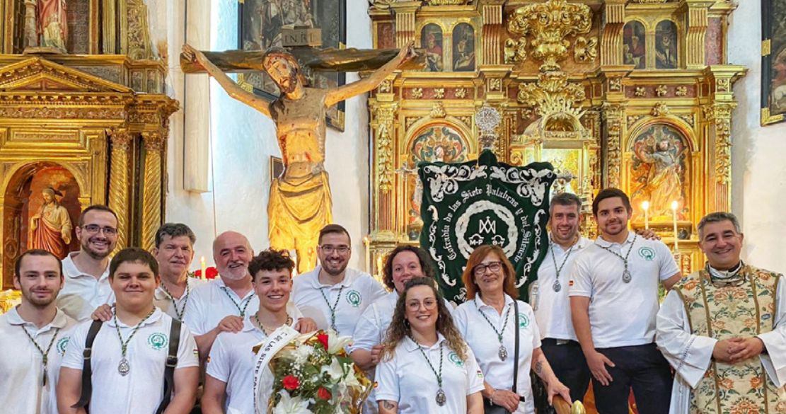
Ofrenda floral al Cristo Abarrancador