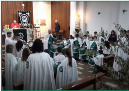
Escuelas de trompetas y tambores, Domingo de Ramos.