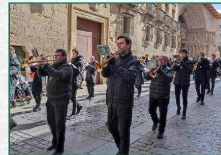
Encuentro Diocesano en Logroño.