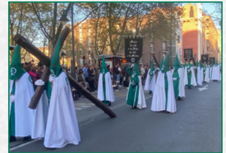
Procesión del Jueves Santo.