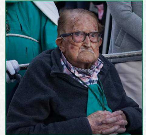
Última procesión de nuestro hermano, Jueves Santo 2023.

Gran persona, siempre con una sonrisa, siempre dispuesto a echar una mano en lo que fuera necesario.