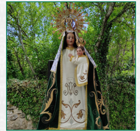
Virgen de Royuela

A continuación, comenzó la procesión por las calles del pueblo. Este año fue diferente gracias a la colaboración de nuestra Cofradía de las Siete Palabras y El Silencio, ya que fuimos alternando nuestras marchas habituales de trompeta y tambores, con los bailes del Grupo de danzas (en el que también participo, aunque este año me tocó estar con la trompeta, jejeje) y con las dulzainas que acompañaban con sus alegres toques, dando como resultado una preciosa procesión con mezcla de folclores.