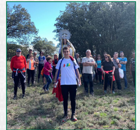
Portando a la Virgen