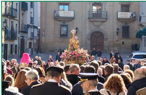
Procesión, Virgen de la Esperanza.

El pasado 23 de abril se celebró en el colegio de Escolapios el día de Escolapios - Provincia Emaús. Tras la eucaristía pudimos disfrutar en convivencia con Itaka. Movimiento Calasanz, CP Calasancio y el APA Escolapios Logroño.